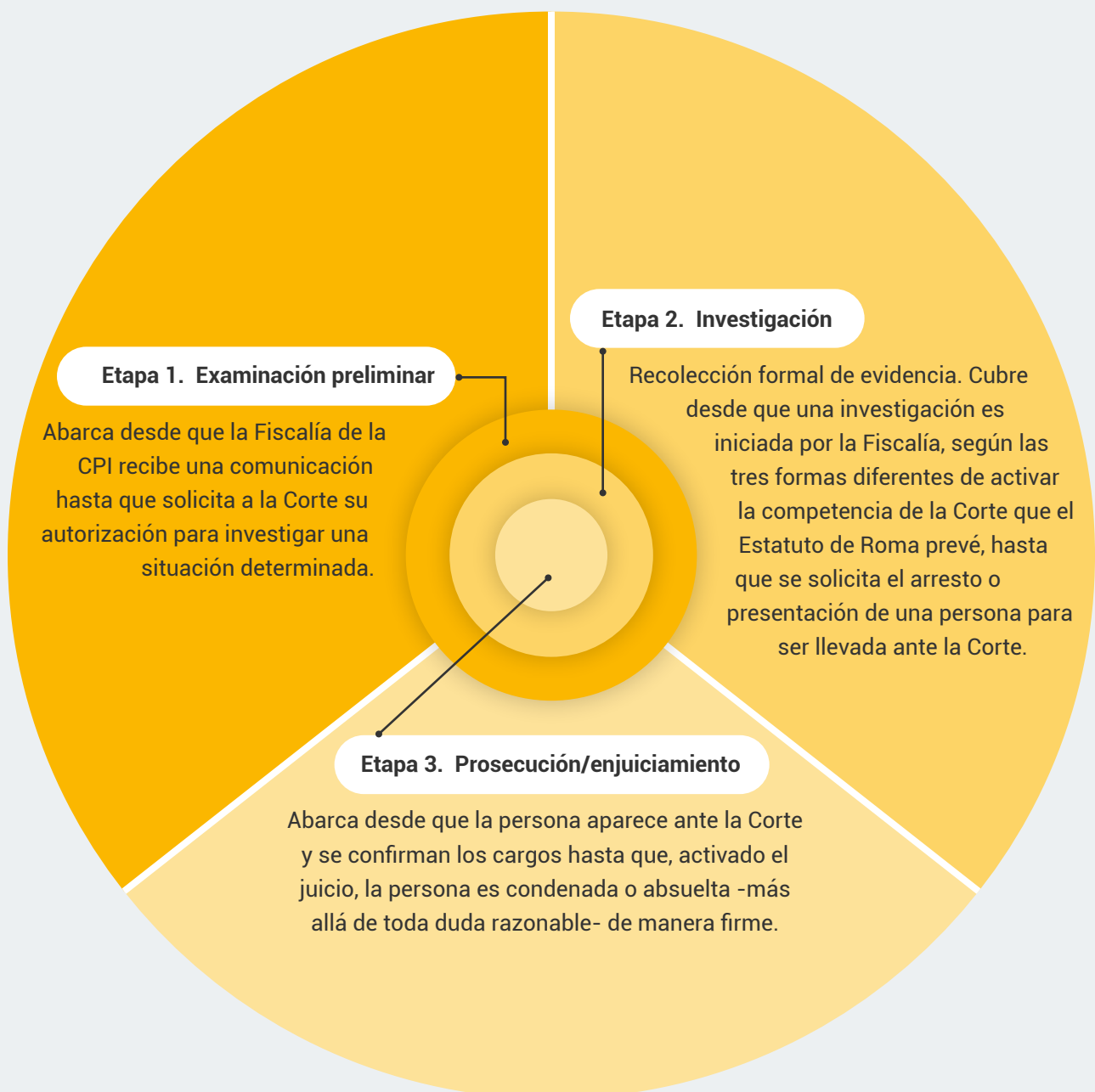
↓ Figura 1. Fases del proceso ante la Corte Penal Internacional

El proceso del trámite de un caso ante la Corte Penal para llegar hasta una sentencia contra una persona consta de tres principales fases concéntricas: la etapa de examinación preliminar, la etapa de investigación previa al juicio ( pre-trial stage ) y la de acusación o procesamiento ( prosecution ) .